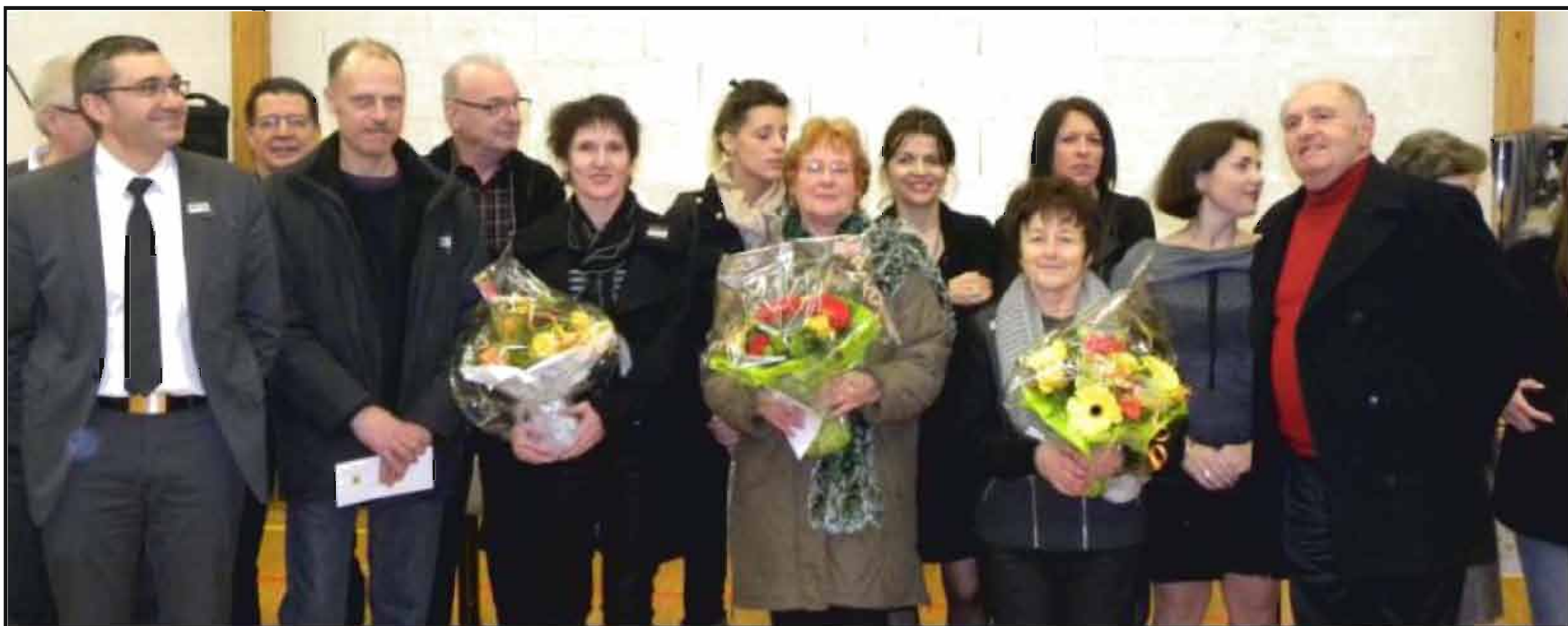
■ Les gagnants du concours des maisons fleuries.

La cérémonie des vœux du maire, vendredi dernier, a été aussi l'occasion de récompenser les gagnants du concours des maisons fleuries. La commission fleurissement, animée par Philippe Bagard, 2 e adjoint, a effectué deux passages pour juger et départager, à partir de critères bien précis, les