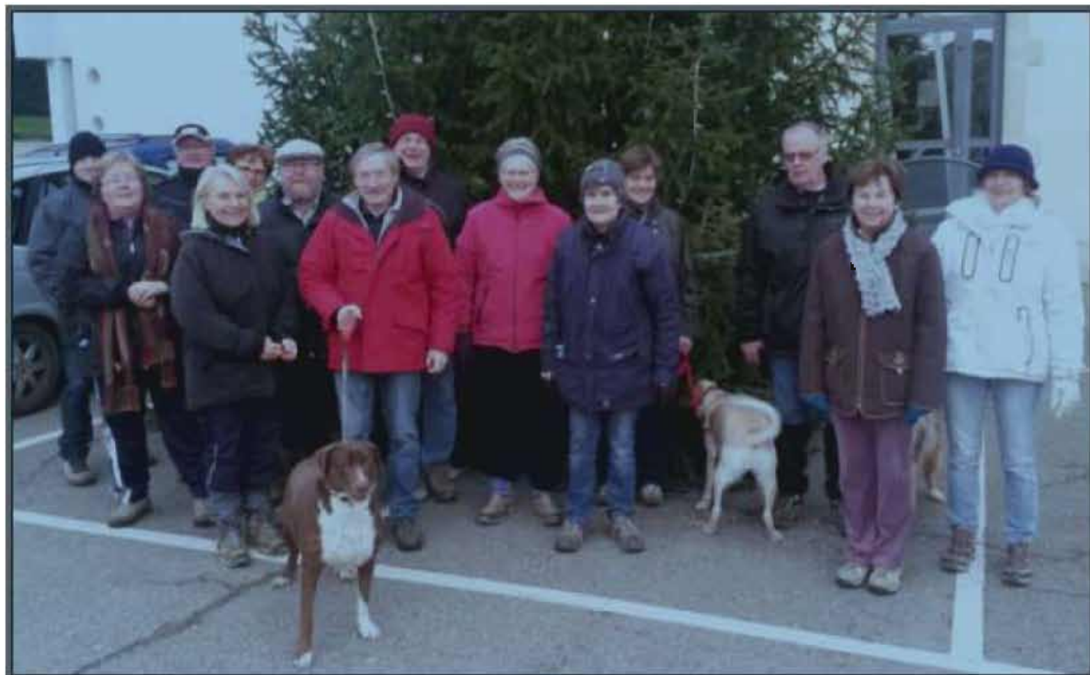
■ Le groupe de marcheurs prêts à partir.

Chaque lundi et jeudi à 9 h précises, ils participent à une marche tonifiante. Ce lundi ils sont quinze devant la mairie et vu la météo venteuse, ils choisissent de se diriger vers la Voivre pour bénéficier de l'abri des arbres. Deux groupes se forment rapidement : les plus alertes, venus là pour tenter d'éliminer les excès des fêtes encore toutes proches ou pour entretenir leur forme,