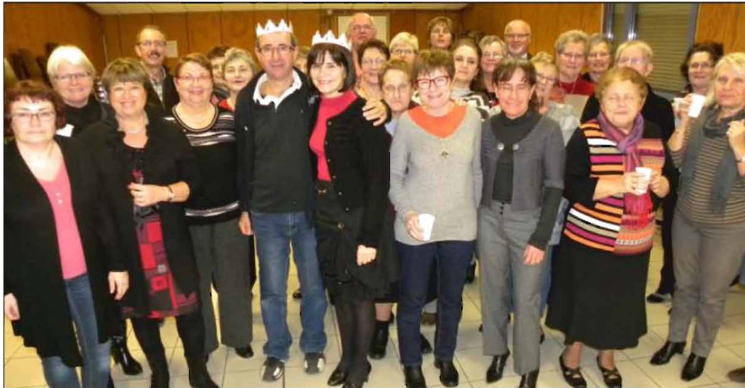
■ Le roi et la reine entourés des choristes.