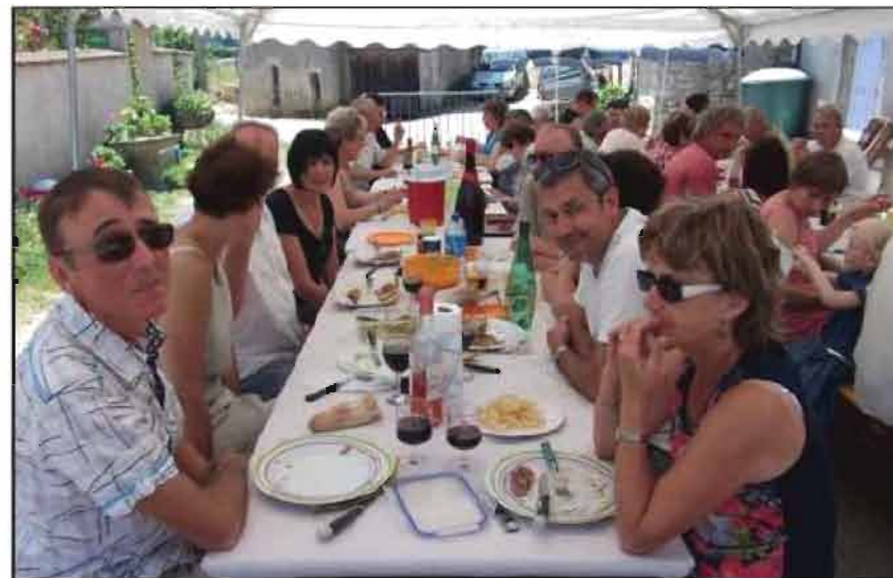
■ Les agapes ont commencé vers midi pour le repas de quartier.

Tous se sont donné rendez-vous à l'année prochaine.