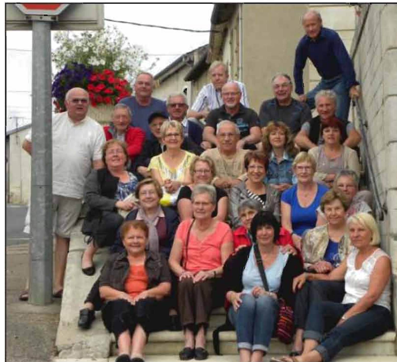
■ Avant le départ.

Le dimanche, pour clôturer le week-end, visite au port de Dienville sur le lac d'Amance et une marche d'une quinzaine de kilomètres.